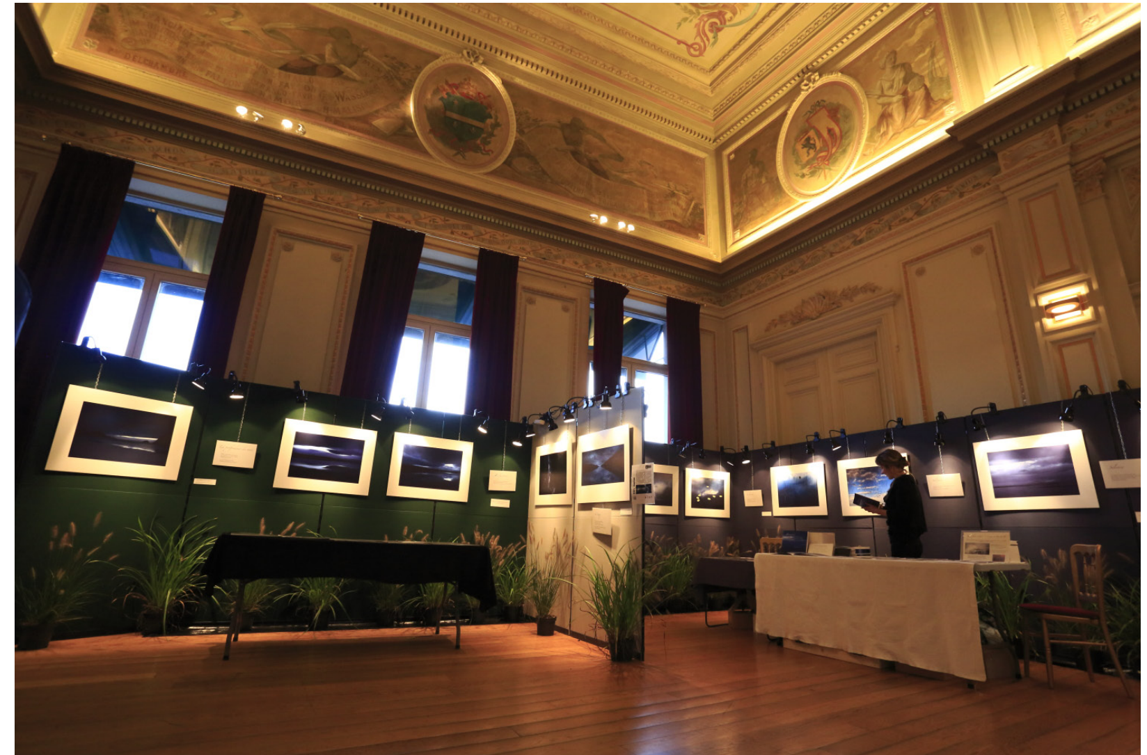
Exposition Festival Nature Namur - oct 2014