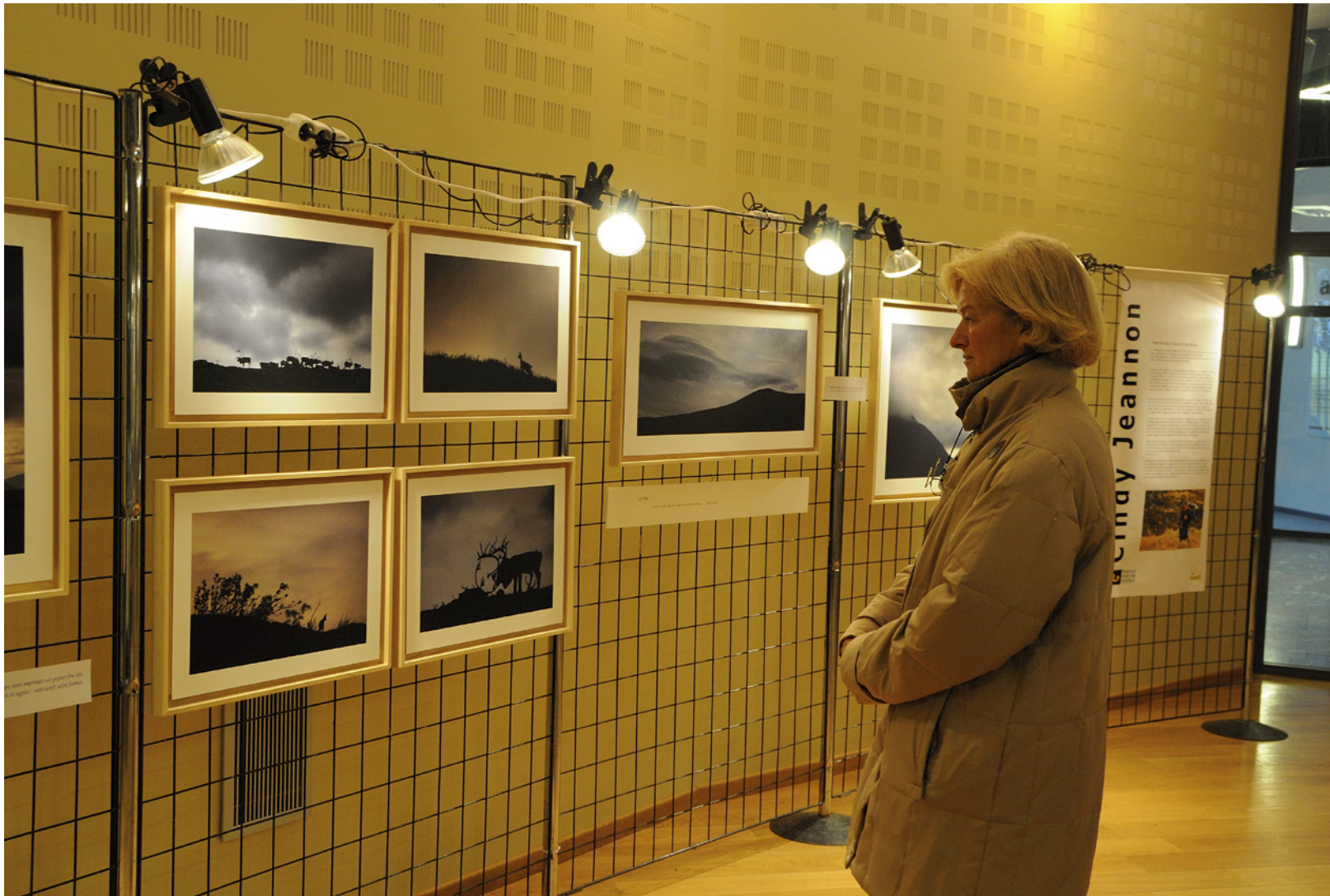
Exposition Festival Nature Namur - oct 2010