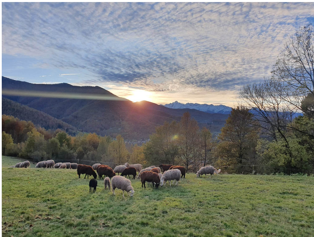
Une des vues du terrain en fin de journée... un jour où le berger passe avec ses brebis :)

Pour venir sur le lieu, il est essentiel de respecter son fonctionnement et mode de vie. Je vous invite à être attentif.ve à toutes les informations contenues dans ce document.